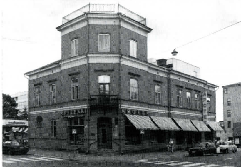
OA:s museum finns på andra våningen i det sk. apotekshuset, Hovrättsesp-lanaden 9. Ingång från baksidan.

under sommarmånaderna samt extra vaktmästare anställd med syssel-sättningsmedel. Under detta år kommer därför tidigare rekord att slås många gånger om. I skrivande stund har vi långt över 5000 besökare redan i år.