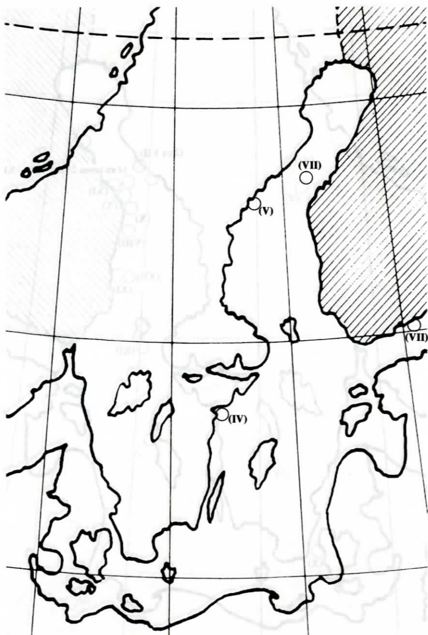
Återfynd från vårflyttningen och sommaren hos äldre fåglar