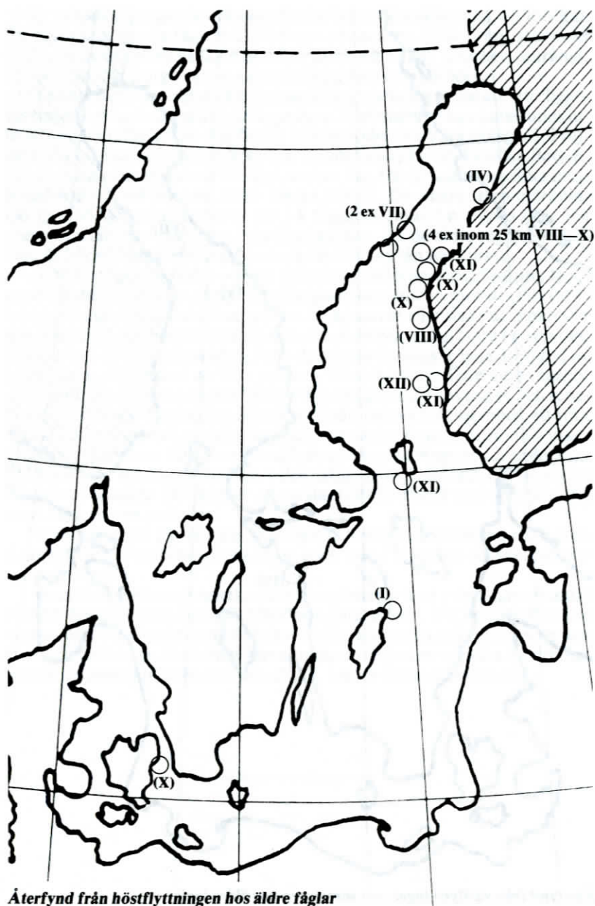
Återfynd från höstflyttningen hos äldre fåglar