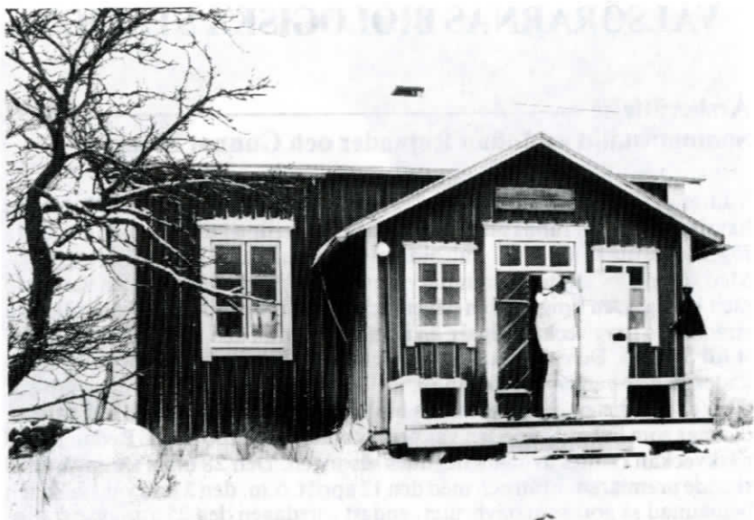
Valsörarnas biologiska station.