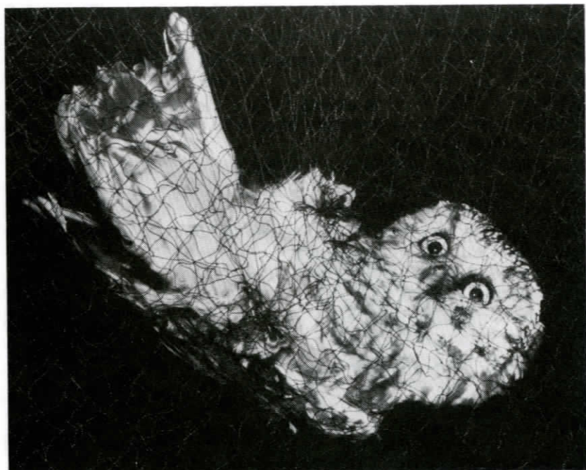
Pärlugglan hör till hösten på Valsörarna.