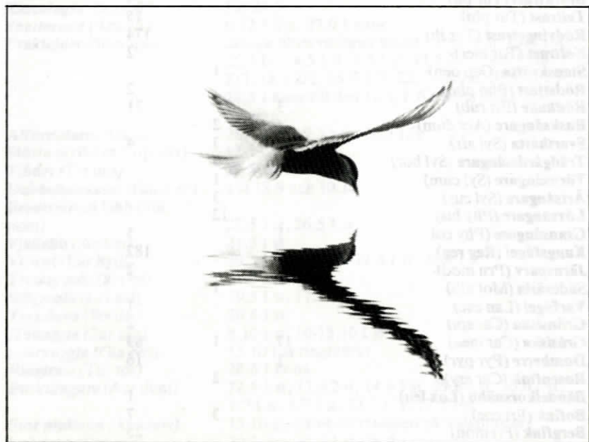
Fjorton silvertärnor ringmärktes 1991.

Sammanlagt observerades 108 arter under hösten. Under året har 183 arter observerats på Valsörarna.