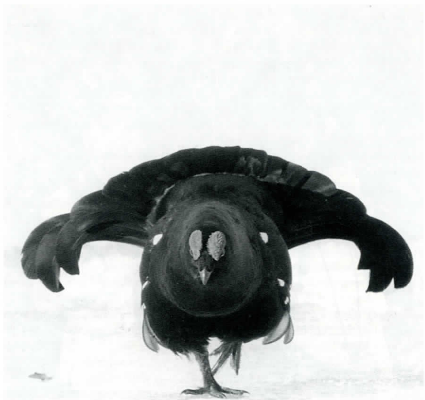
Orrtupp. Åkant träsk, Oravais 17.4.1979