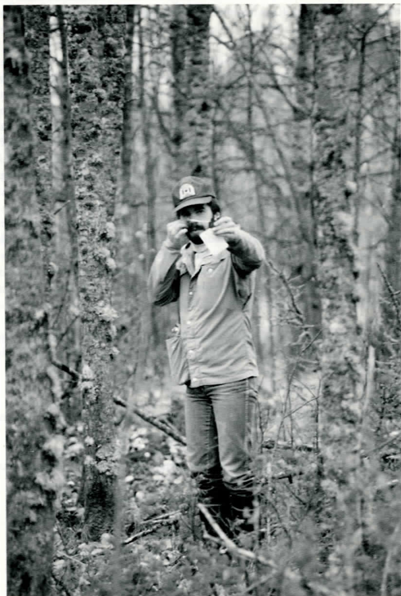
Tänk att få betalt för att ströva i skog och mark... Med relaskopet i österbottnisk sumpskog, hösten 1981