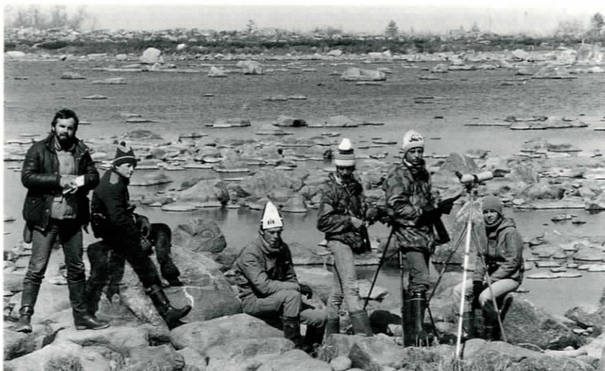
Som kursledare för OA-juniorer på Valsörarna våren 1982

På Valsörarna räknades mellan den 27 juli och 29 augusti ca 13 000 exemplar på väg över Kvarken mot väst och nordväst – trots en veckas avbrott i observationsverksamheten. De bästa sträckdagarna den 11 och 15 augusti sågs 2000 respektive 3000 nötkräkor, men dessa siffror torde vara i underkant eftersom man på Holmön på andra sidan Kvarken, den 11 augusti räknade hela 4500 exemplar.