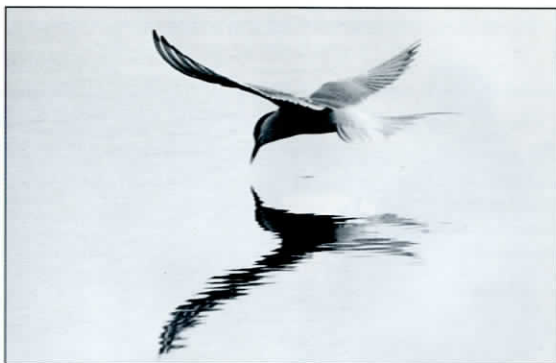
I Käringsund plockade silvertärnorna nyckläckta fjädermyggor, medan rastande blåhakar sjöng i strandskogen.

”En solnedgångsdominerad kvällsstund på västra sidan gav inget i flyttväg – endast en storlom och tio sjöorrar. Gunnar målade kvällshimlen, medan sjöbevakarna prejade en fiskebåt.”