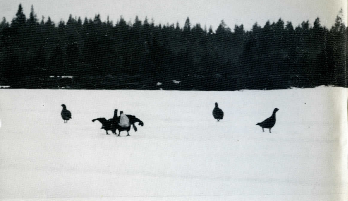
Orrspel i Oravais.